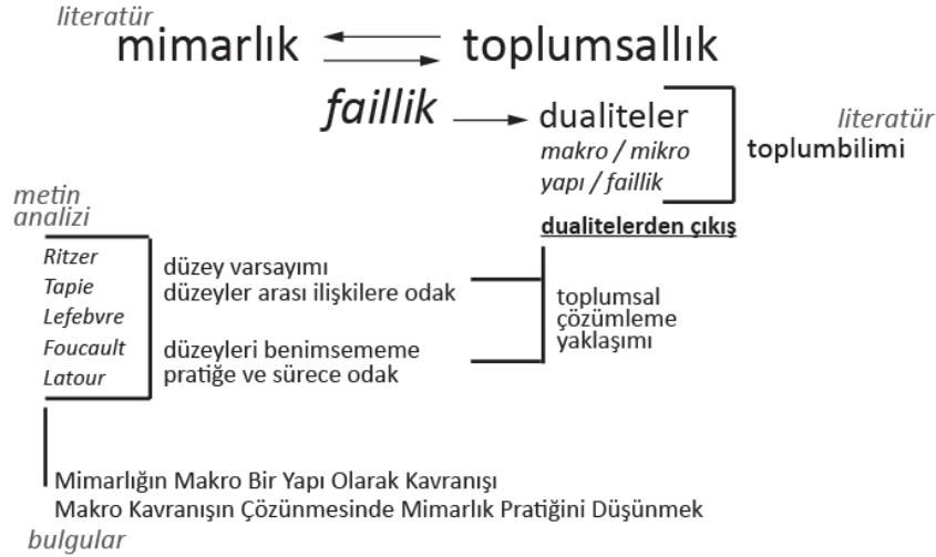
Görsel 1. Çalışmanın izlediği yol